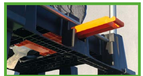
Plate-forme de réception du système de bigbags Vario